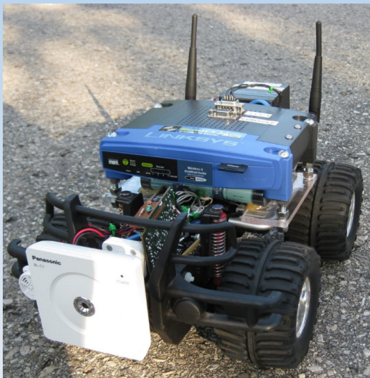
WLAN RC Auto